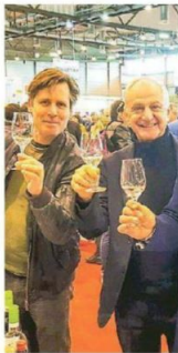
Un brindisi a Montpellier